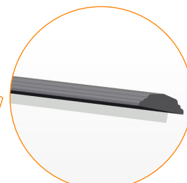
CORRIMANO SAGOMATO IN ACCIAIO 50x15 mm.