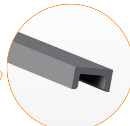
PROFILATO IN ACCIAIO A "U" 40x20 mm.