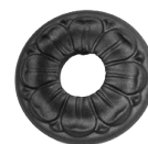
BA 03 LS ROSETTA COPRIFORO