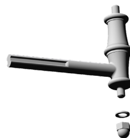
BA 02 LS ATTACCO LATERALE

L'ALTEZZA DELLE COLONNE PUO' VARIARE IN BASE ALLE DIMENSIONI DEL GRADINO